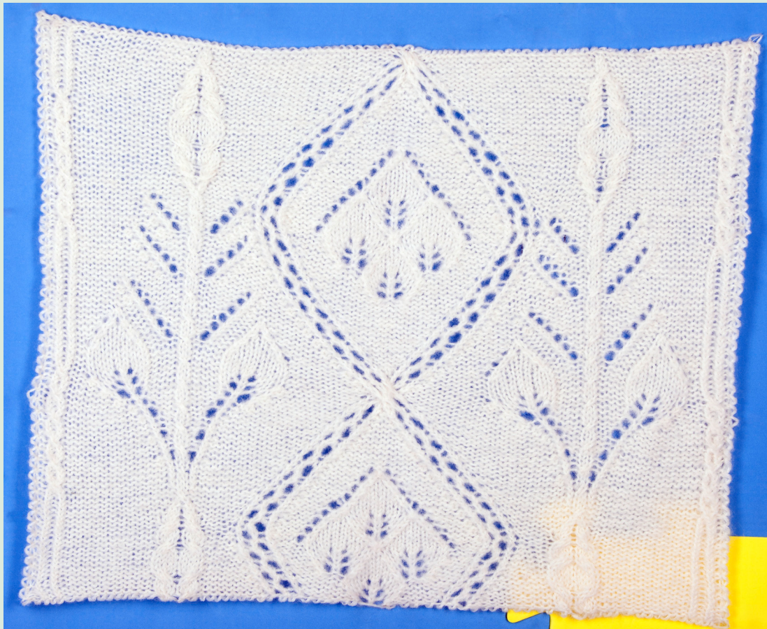
Образец связан на 89 петлях и 103 рядах. На схеме приведены лицевые ряды. Изнаночные ряды вяжутся по рисунку.