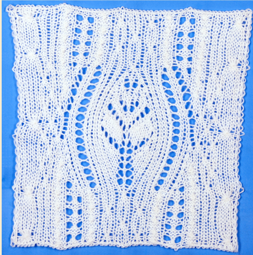
Образец связан на 61 петле и 69 рядах. На схеме приведены лицевые ряды. Изнаночные ряды вяжутся по рисунку.